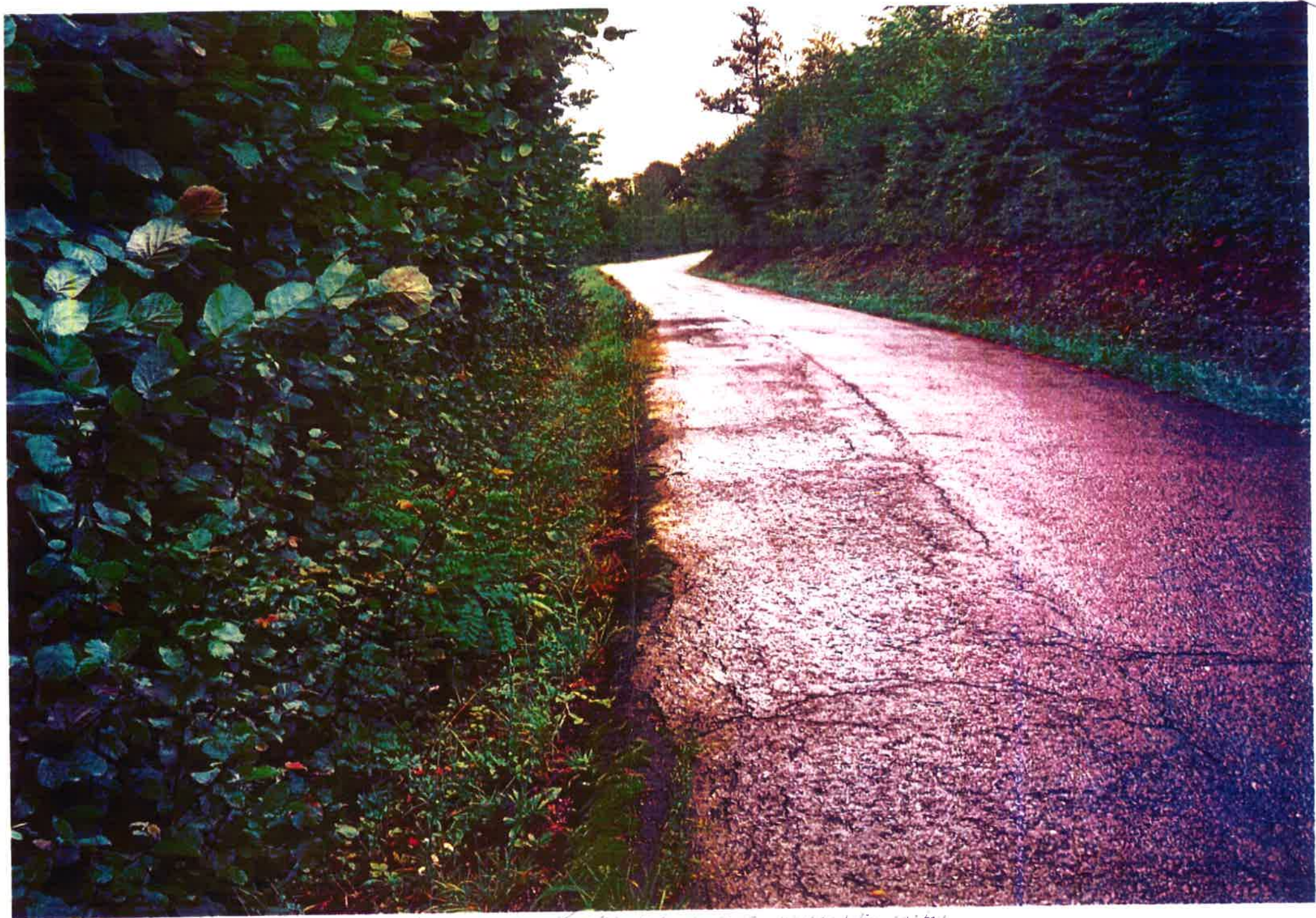
tento je hned vedla cesty je prava krasivost cesty